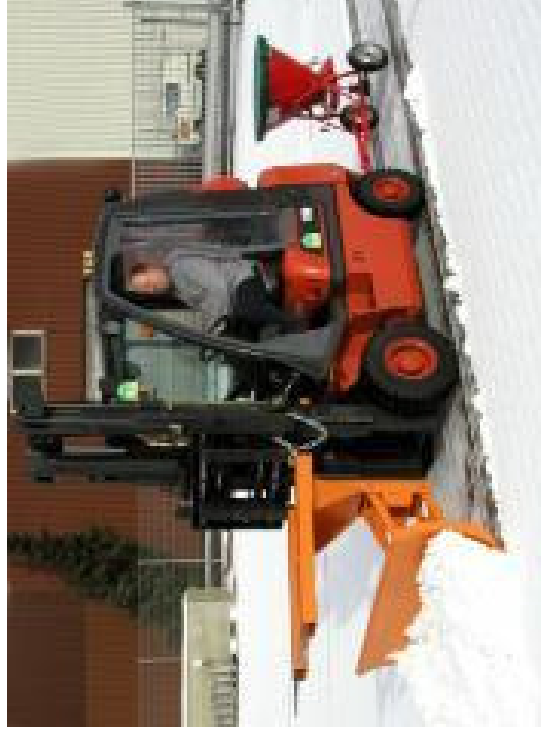
Gabelzinkenschutz zur Sicherung im Straßenverkehr.